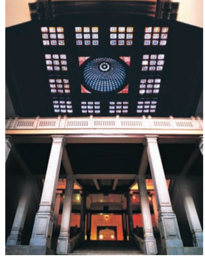
İstanbul Lisesi iç mekânlar... (üstte). Istanbul Lycée interiors... (above).

Çok sayıda devlet ve bilim adamı, sanatkar yetiştirir İstanbul Lisesi. Aralarında 2 başbakan, onlarca bakan vardır. Rekor, 6 İstanbul Liseli bakanla, 1955 yılı Türkive Cumhuriveti hükümetindedir. Birinci Dünya Savaşı'nın kaybıyla 1918 senesinde ara verilen Almanca eğitim, Türkiye ile Almanya arasında imzalanan anlasma ile 1958 senesinde tekrar baslar, 1964 senesinde ilk kız öğrenciler okula alınır. 1982'de okul 1910'daki adına döner, yeniden İstanbul Lisesi olur.